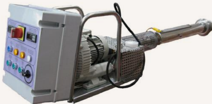
Electrofog 8KW Venturi Electrofog 11KW Venturi